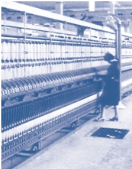
Un'immagine d'epoca della Filatura Cantoni di Castellanza, oggi sede dell'Università

comunicazione, valutare il cammino fatto, analizzare la propria immagine. La mediateca è articolata in più sezioni: quella storica raccoglie i filmati industriali d'interesse storico. Sarà poi attivata una sottosezione fotografica e si prevede la progettazione di un Museo del manifesto industriale. La sezione pubblicitaria raccoglie materiale di carattere prettamente pubblicitario. Quella immagine, infine, raccoglie, a partire dal 1970, la documentazione audiovisiva prodotta per fini diversi da quelli pubblicitari e, in particolare, i filmati presentati nel corso della Settimana della Comunicazione d'Impresa promossa da Confindustria, AssAP e FiG.