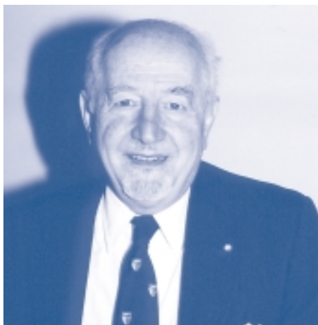
Il Prof. Guido Calabresi

quanto riguarda sia la didattica, sia la ricerca, sia lo sviluppo delle relazioni internazionali e la conseguente crescita del numero degli allievi che svolgono periodi di studio all'estero. "Uno dei cardini del programma che ho inteso realizzare in questi anni, come annunciavo all'inizio del mio mandato, è l'internazionalizzazione del nostro Ateneo e dei nostri studenti. L'obiettivo è stato quello di costruire un contesto multiculturale in cui i nostri allievi e quelli stranieri potessero crescere professionalmente e socialmente. Ebbene, abbiamo nel tempo aumentato il numero dei corsi in inglese del nostro curriculum e con ciò abbiamo facilitato i nostri studenti a vivere un'esperienza internazionale senza mobilità e ovviamente abbiamo attratto un maggior numero di studenti stranieri. In modo corrispondente è stato però anche sviluppato il numero e migliorata la qualità degli accordi internazionali. Questo ci ha permesso di porre una forte enfasi sui progetti che offrono l'opportunità di stage all'estero e di proporre stage in Italia a studenti stranieri".