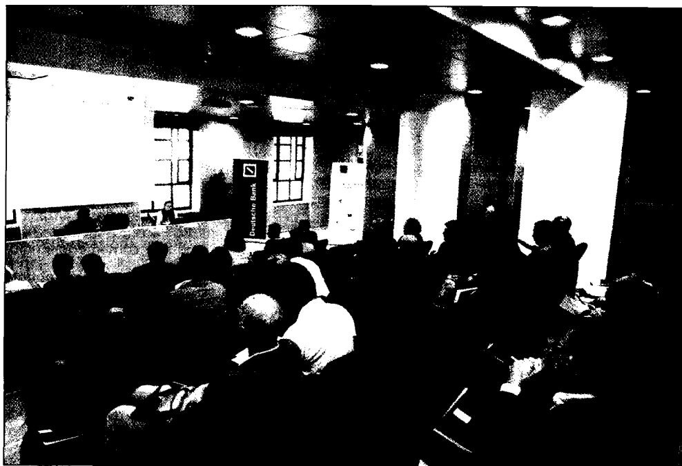
Sopra e a destra: il pubblico intervenuto.